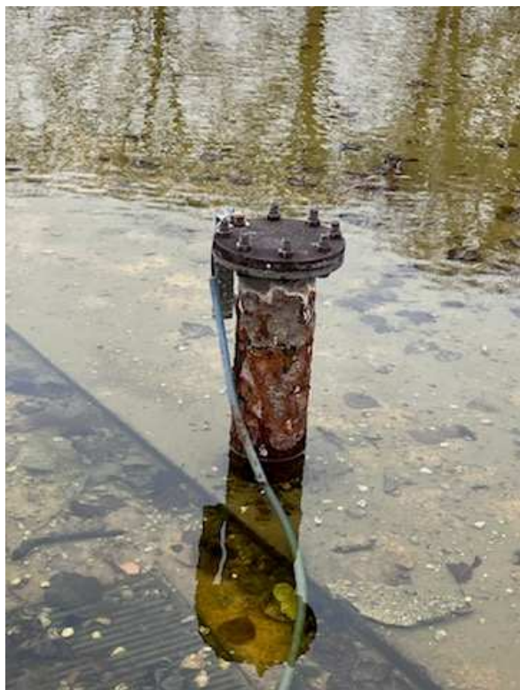
Sonde remplissage auto